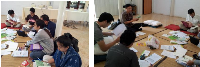
ทำงานกันอย่างจริงจัง

๕ กรกฎาคม ๒๕๕๕ ทีมงานสช.เกือบ ๑๐ คน เดินทางไปสมุทรสาครกันตั้งแต่เช้าตรู่ เป้าหมาย อยู่ที่บ้านคู้้งน้ำรีสอร์ท พวกเราไปประชุมเพื่อทบทวนแนวทาง (guideline) การจัดสมัชชาสุขภาพเฉพาะพื้นที่และสมัชชาสุขภาพเฉพาะประเด็น ซึ่งแนวทางนี้ คณะกรรมการพัฒนาสมัชชาสุขภาพเฉพาะพื้นที่และสมัชชาสุขภาพเฉพาะประเด็น (คพส.) ที่คสช.แต่งตั้ง มีคุณหมอสุวิทย์ วิบุลผลประเสริฐ เป็นประธาน ได้ให้ความเห็นชอบให้ใช้มาตั้งแต่ปี๒๕๕๔